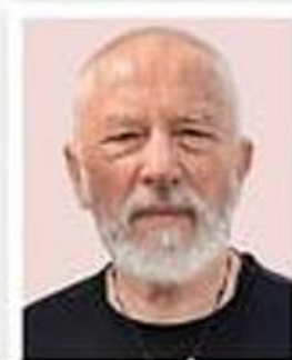
ZDENĚK LHOTÁK fotograf

Když chci udělat manželce radost, zajdu do klenotnictví. Rozhoduji se mezi brilianty, diamanty, perlami.